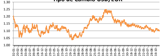
Tipo de Cambio USD/EUR