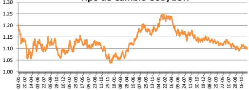
Tipo de Cambio USD/EUR