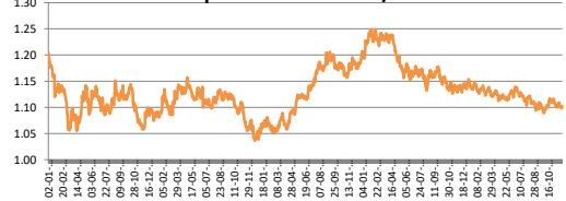
Tipo de Cambio USD/EUR