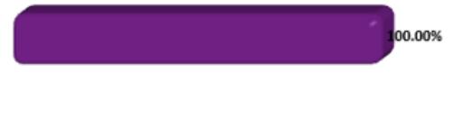
CONCENTRACIÓN POR INSTRUMENTO FONDO CONFIANZA BP DOLARES