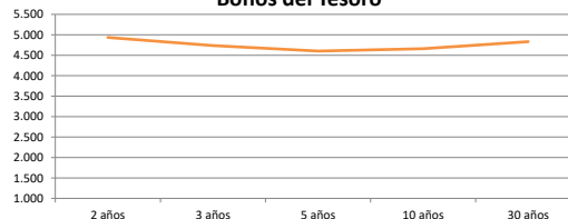
Bonos del Tesoro