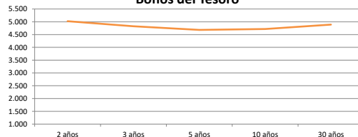
Bonos del Tesoro