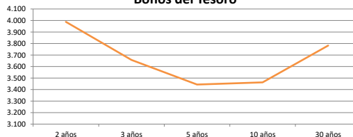
Bonos del Tesoro