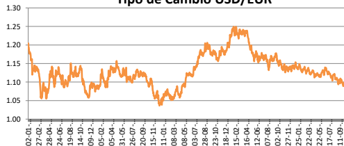
Tipo de Cambio USD/EUR