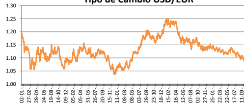
Tipo de Cambio USD/EUR