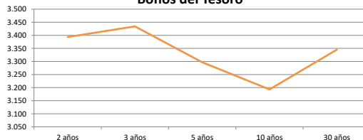
Bonos del Tesoro