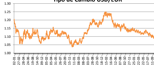
Tipo de Cambio USD/EUR