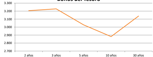
Bonos del Tesoro