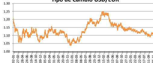
Tipo de Cambio USD/EUR