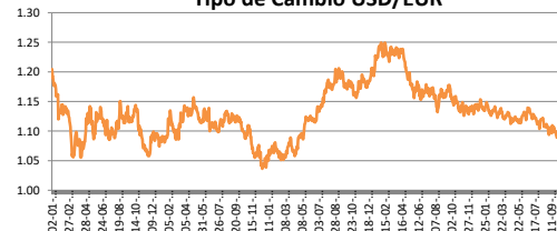
Tipo de Cambio USD/EUR