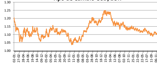
Tipo de Cambio USD/EUR