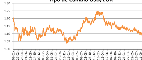
Tipo de Cambio USD/EUR