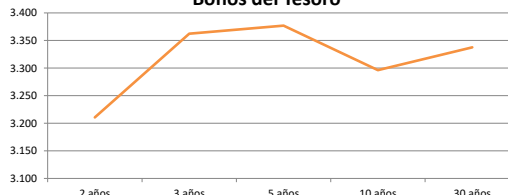
Bonos del Tesoro