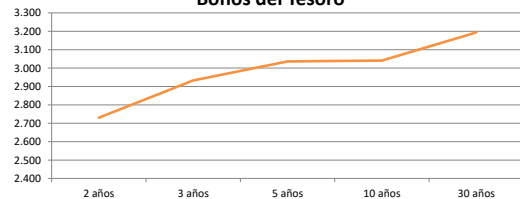
Bonos del Tesoro