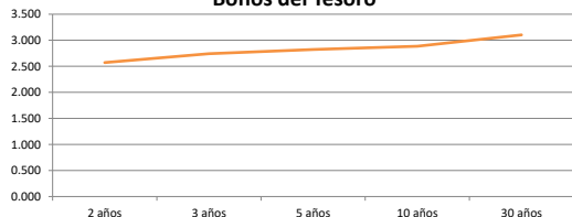
Bonos del Tesoro