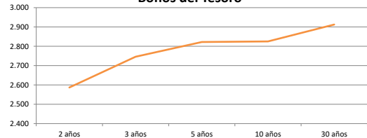
Bonos del Tesoro