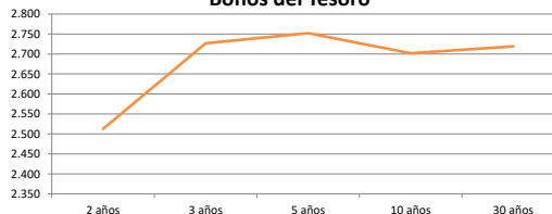
Bonos del Tesoro