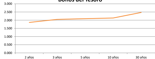
Bonos del Tesoro