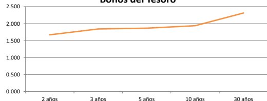
Bonos del Tesoro