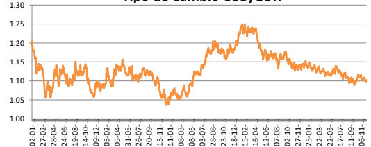
Tipo de Cambio USD/EUR