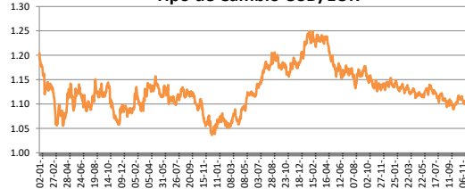
Tipo de Cambio USD/EUR