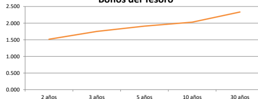
Bonos del Tesoro