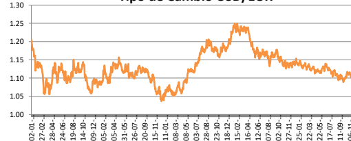
Tipo de Cambio USD/EUR