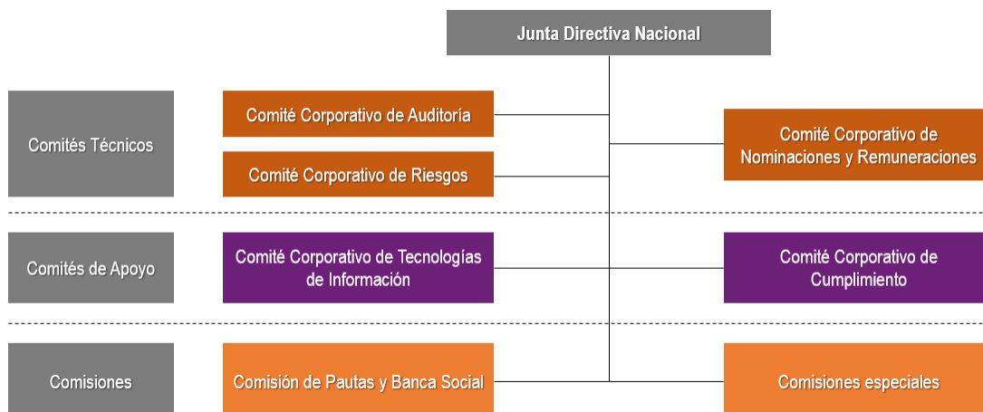
Figura 2. Organización de los Comités Técnicos, de Apoyo y de los Comités

Con el fin de fortalecer la visión conglomeral, la Junta Directiva Nacional ha conformado la siguiente estructura de Comités y Comisiones para el funcionamiento de la gobernanza en el Conglomerado Financiero: