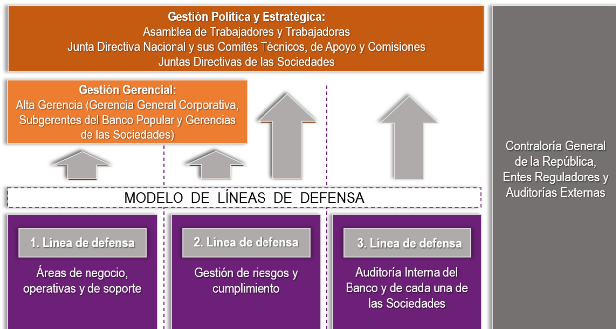
Figura 1. Estructura y organización del Gobierno Corporativo del Conglomerado Financiero

La clave para un buen Gobierno Corporativo radica en su estructura y organización, es por ello que el Conglomerado Financiero se organiza mediante un modelo de líneas de defensa, tal como se muestra a continuación: