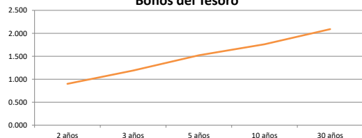
Bonos del Tesoro