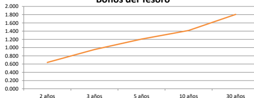
Bonos del Tesoro