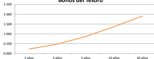
Bonos del Tesoro