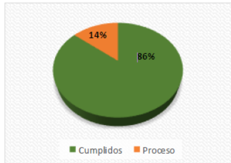
Gráfico No. 1 Grado de Cumplimiento al 30 de junio de 2021