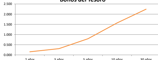
Bonos del Tesoro