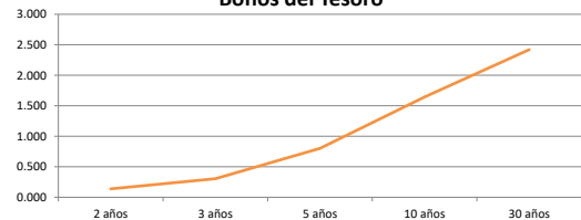
Bonos del Tesoro