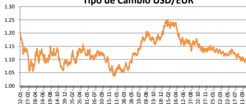
Tipo de Cambio USD/EUR