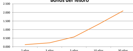
Bonos del Tesoro