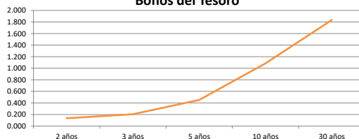
Bonos del Tesoro