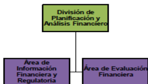
Figura N° 9 Estructura interna planteada para la División de Planificación y Análisis Financiero