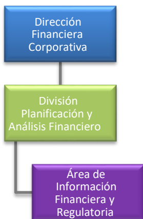
Figura N° 2 Estructura División Planificación y Análisis Financiero

Mediante el Acta-63- DIRCH-2019 de la Dirección de Capital Humano del día 05 de diciembre 2019, se aprueba el cambio de estructura de la División de Planificación y Análisis Financiero donde se hace referencia al estudio integral aplicado a la Dirección Financiera Corporativa, el